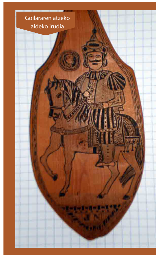
Goilararen atzeko aldeko irudia

Zerren zain zabilta? Jarraitu Bidankozarte !!