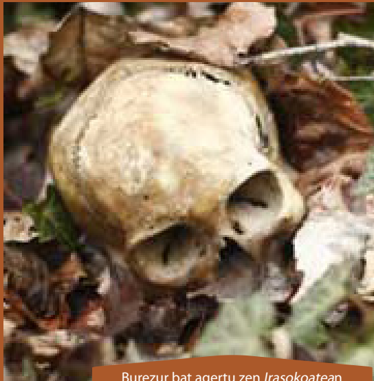
Burezur bat agertu zen Irasokoatean