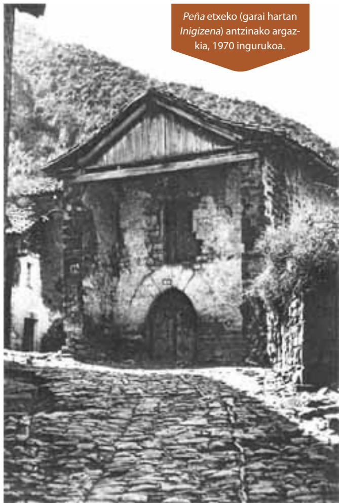
Peña etxe (garai hartan Inigizena ) antzinako argazkia, 1970 ingurukoa.