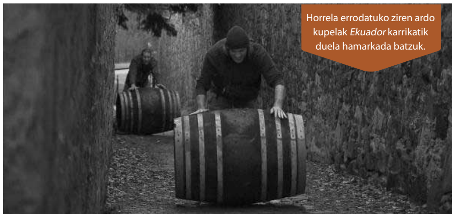
Horrela errodatuko ziren ardo kupelak Ekuador karrikatik duela hamarkada batzuk.