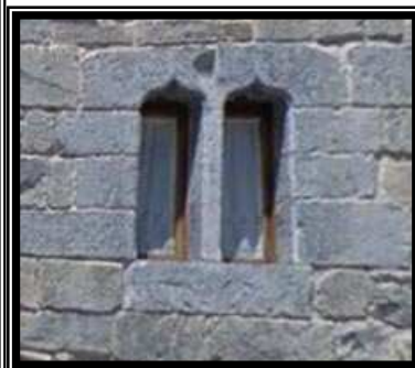
Ordutik atzera egitean askoz