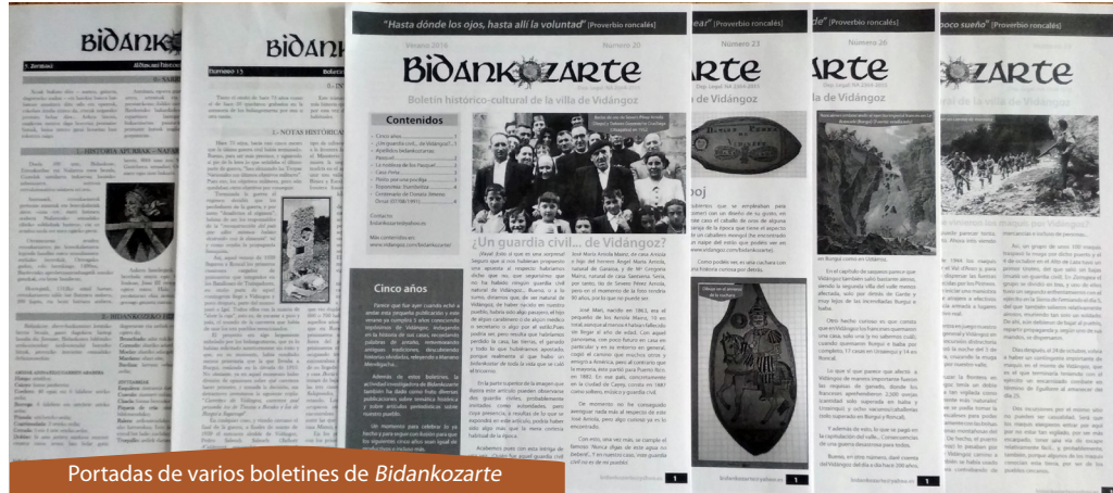
Portadas de varios boletines de Bidankozarte

Es por ello que, aprovechando este aniversario redondo haré una especie de alto en el camino de esos que se hacen subiendo un monte, en algún collado, desde el que miras hacia atrás y entonces te das cuenta de cuánto has subido, de todo lo que has avanzado... y sin embargo, todavía queda camino por andar, tanto como ganas y fuerzas nos queden en el cuerpo. En mi caso, al menos, voy bastante bien de ambas, y espero que en el de quienes seguís esta publicación, también. Vamos, pues, a recapitular y a ver todo lo que ha dado de sí esta década de Bidankozarte .